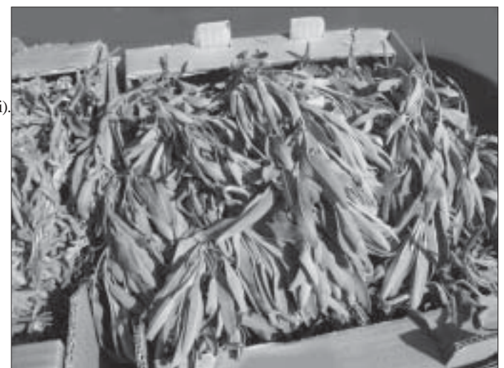
Sherebelë e vendosur në një panair bujqësor (Malësi e Madhe)