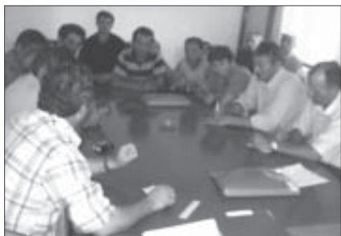
Nga takimi në Kthellë

N ë një takim të organizuar nga Federata e Përdoruesve të Pyjeve të Lezhës, mbështetur nga PZHBN dhe SNV, në Komunën Kthellë, ndër shumë shembuj që përmendën drejtuesit e komunes dhe ata të Shoqatës, na tërhoqën vemendjen edhe përpjekjet që kishin bërë ata për ndarjen e pyjeve sipas traditës dhe secili të mbronte pjesën e vet.