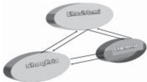
Sistem natyror ekonomik prodhimit

Në këtë shkrim do desha ti adresohesha sfidës së ndërtimit të aftësisë ripërtëritëse në trinomin e sistemit natyror ekonomik të prodhimit (ekosistem-shoqëri-ekonomi), përmes lenteve të analizës institucionale.